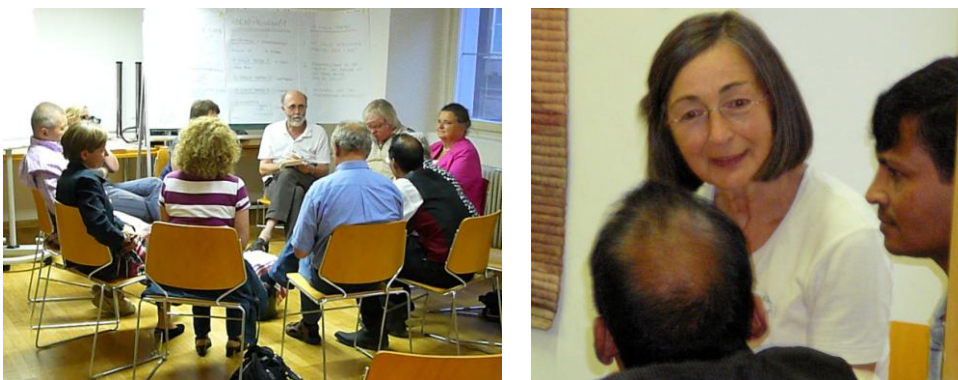
Austausch, Abwechslung, Zuhören