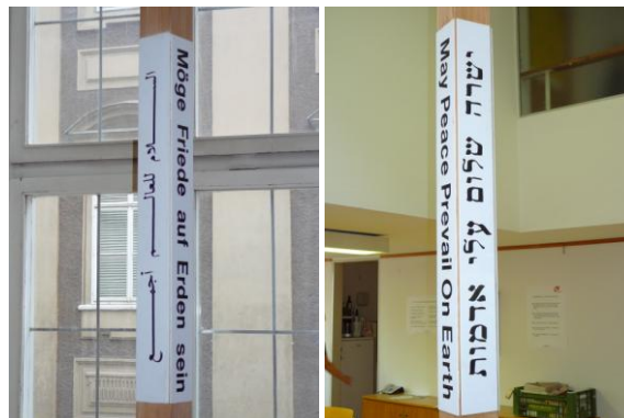
Friedenspfahl mit Inschrift, in vier Sprachen

An die 30 Teilnehmer/-innen sind der Einladung gefolgt, „über den eigenen Tellerrand zu blicken“.